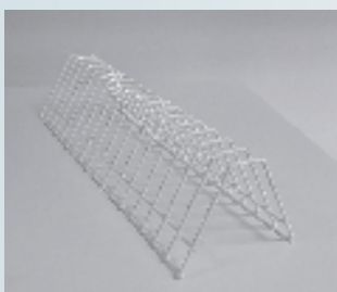
** Stojak na 17 maseczek